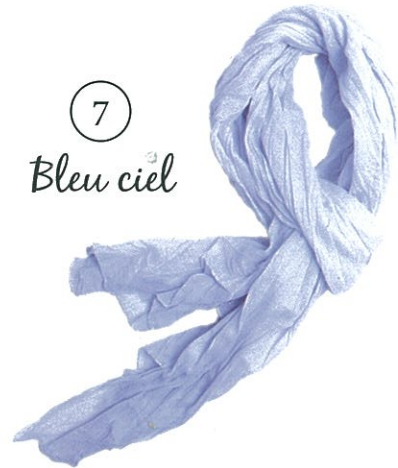
7 Bleu ciel