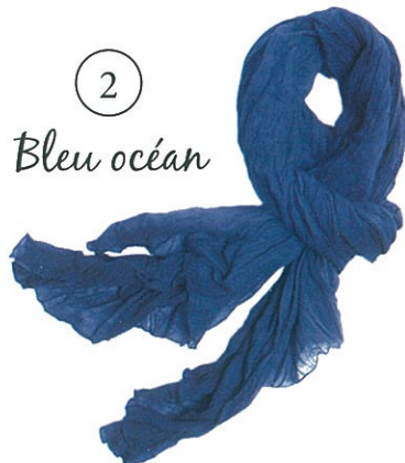
2 Bleu océan