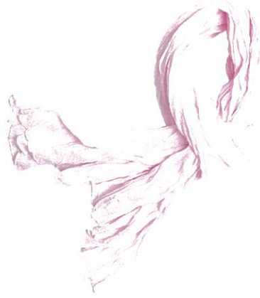
9 Rose pâle