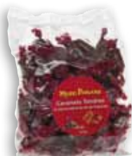
BT9869 / BT9870