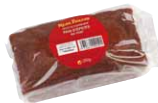
BT1601 / BT1611