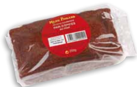
BT9931 / BT9929 / BT9951

BT1611 Pain d'épices aux figues .....100g BT9875 Crème de caramel .....220g BT9554 Confiture de lait .....220g BT9876 Coulis de caramel .....320g